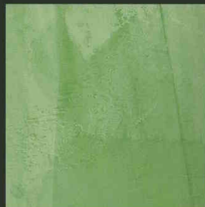
C6 ML150 + C2 ML150

LE FORMULE INDICATE SONO RIFERITE AD UNA CONFEZIONE 24 KG DI ANTICA CALCE DEL METAURO