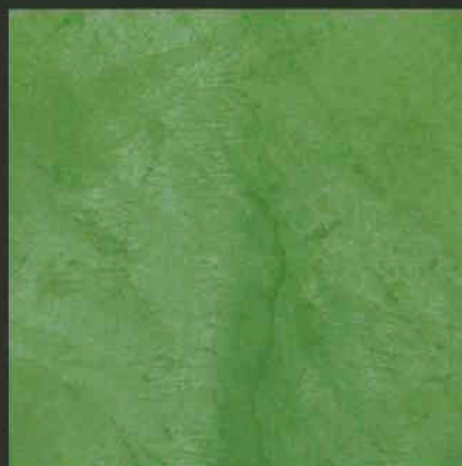
C6 ML450 + C2 ML450