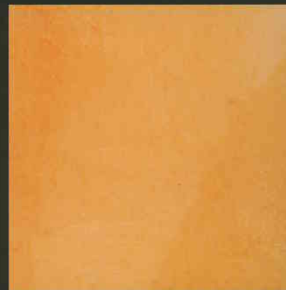
C1 ML720 + C3 ML240