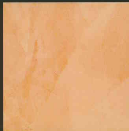
C1 ML150 + C3 ML150