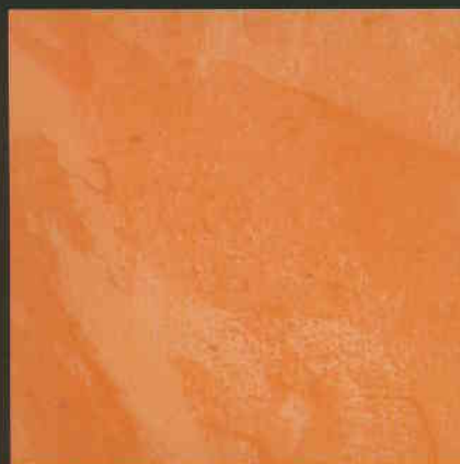
C1 ML450 + C3 ML450