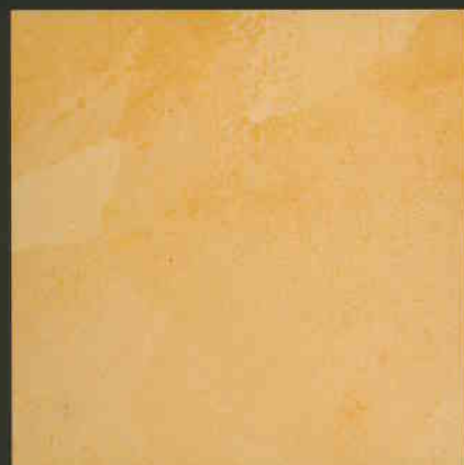
C1 ML240 + C3 ML80